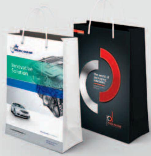
MERCANLAR OTOMOTİV - PADA MAKİNA Kağıt Çanta Çalışması