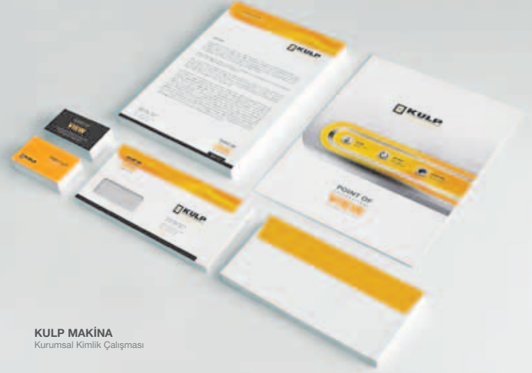
KULP MAKİNA Kurumsal Kimlik Çalışması