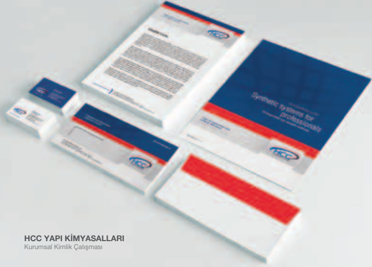
HCC YAPI KİMYASALLARI Kurumsal Kimlik Çalışması