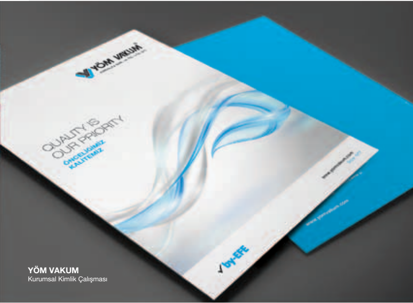
YÖM VAKUM Kurumsal Kimlik Çalışması