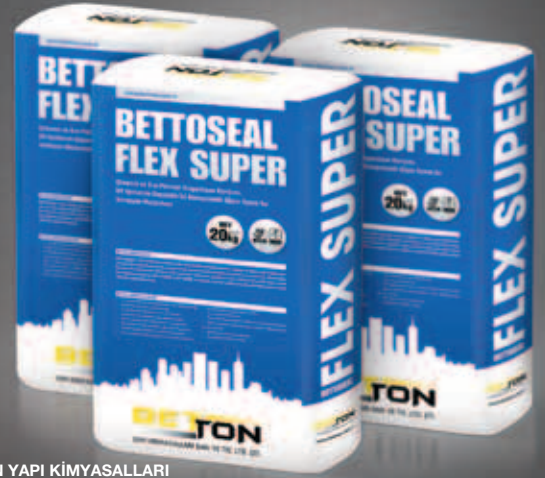
BETTON YAPI KİMYASALLARI Çimento Torbası Tasarımları