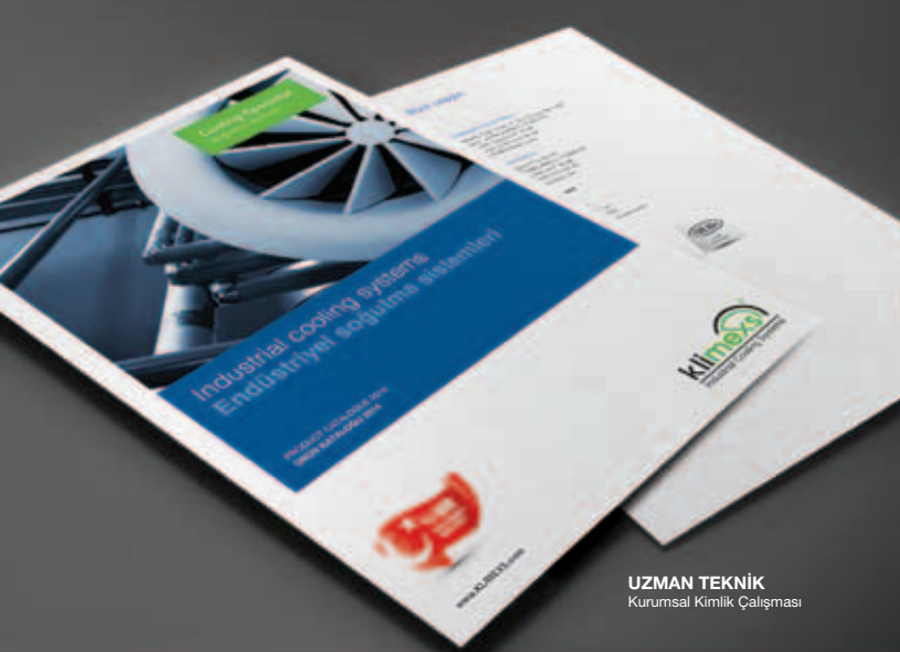
UZMAN TEKNİK Kurumsal Kimlik Çalışması