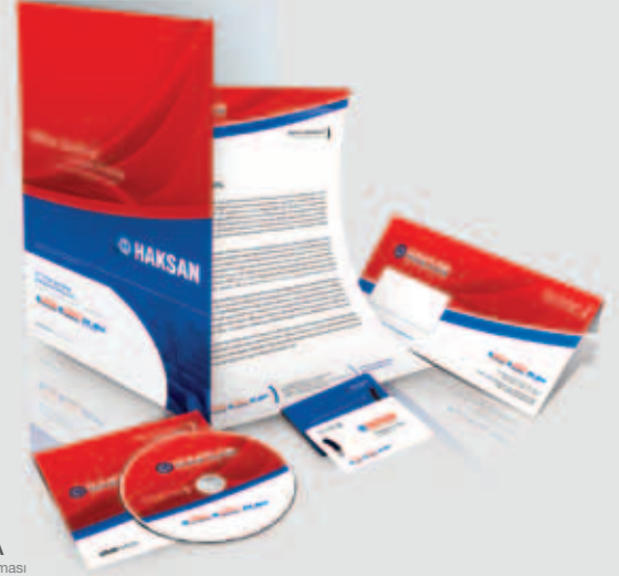
HAKSAN MAKİNA Kurumsal Kimlik Çalışması