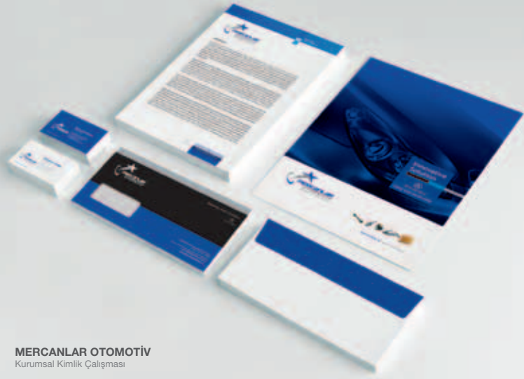
MERCANLAR OTOMOTİV Kurumsal Kimlik Çalışması