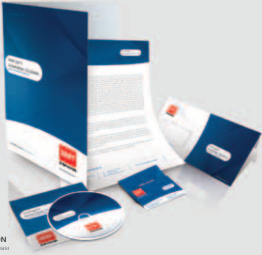
SERT OTOMASYON Kurumsal Kimlik Çalışması