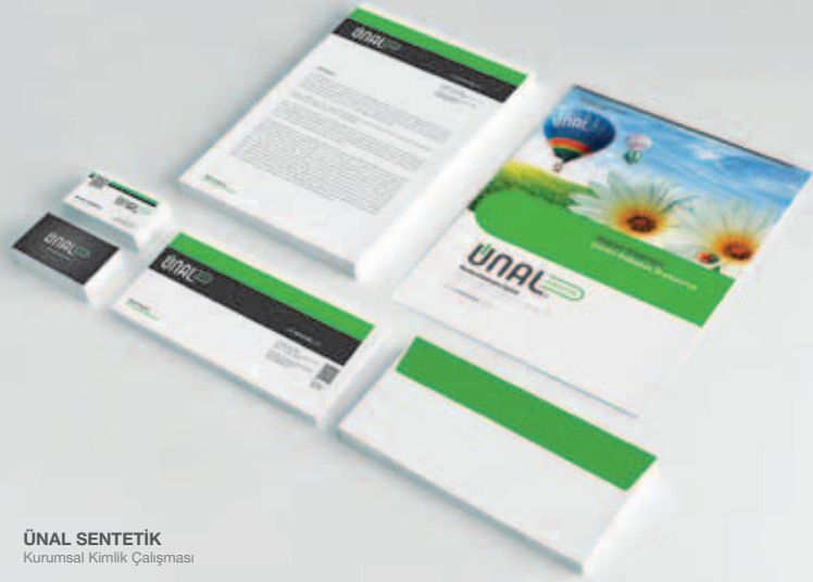
ÜNAL SENTETİK Kurumsal Kimlik Çalışması