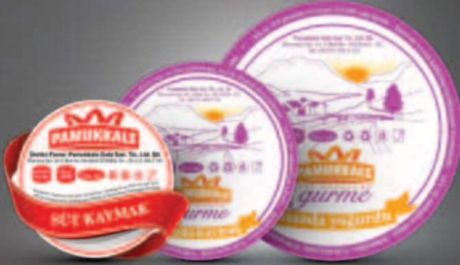
PAMUKKALE Etiket Tasarımları