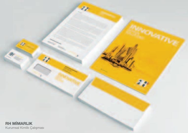
RH MİMARLIK Kurumsal Kimlik Çalışması