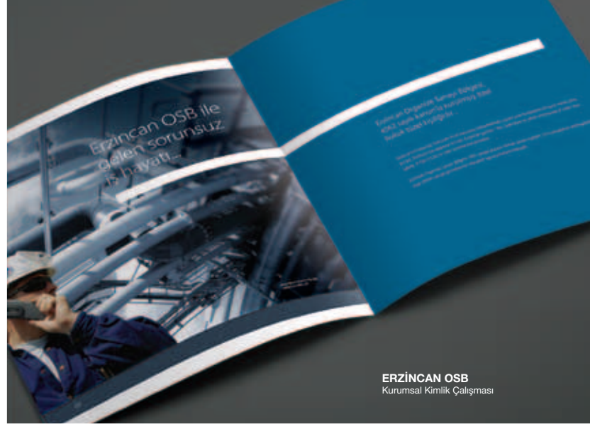
ERZİNCAN OSB Kurumsal Kimlik Çalışması

Sude Yayıncılık, çeşitli ebatlar ve özelliklerde ürün broşürü, genel firma kataloğu, insert vb. çalışmalarda farklı sektörlerden bir çok firmaya hizmet vermektedir.