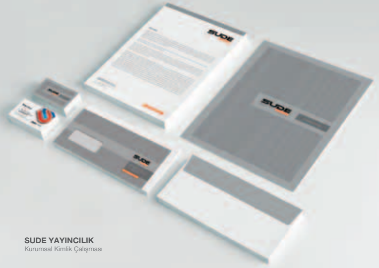
SUDE YAYINCILIK Kurumsal Kimlik Çalışması