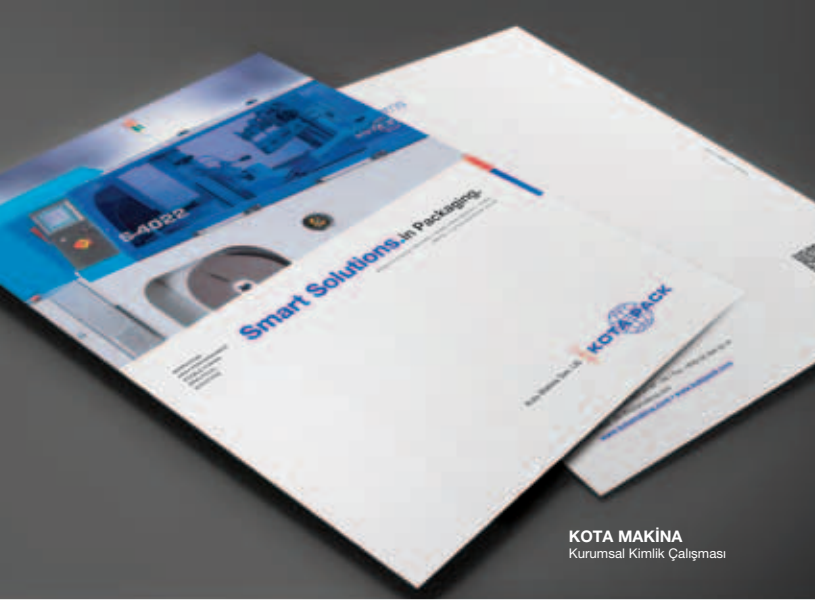
KOTA MAKİNA Kurumsal Kimlik Çalışması