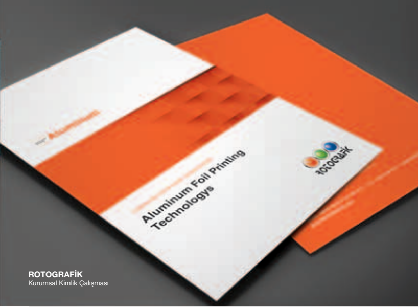
ROTOGRAFIK Kurumsal Kimlik Çalışması