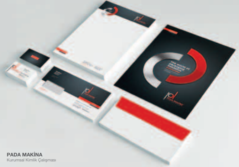
PADA MAKİNA Kurumsal Kimlik Çalışması