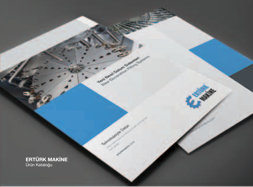
ERTÜRK MAKİNE Ürün Kataloğu