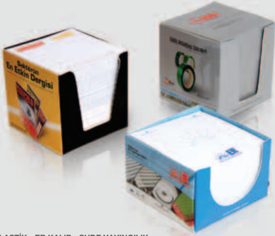
ONUR PLASTİK - ER KALIP - SUDE YAYINCILIK Küp Notluk Çalışmaları