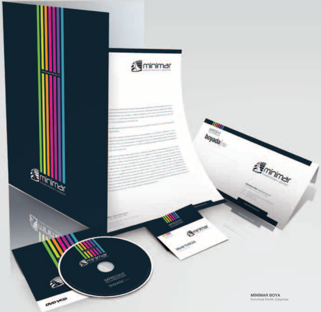
MINİMAR BOYA Kurumsal Kimlik Çalışması