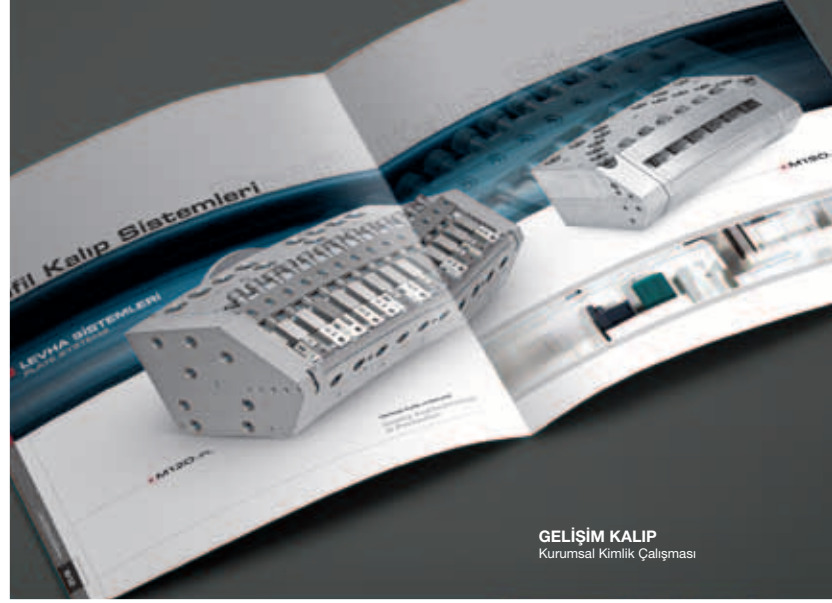
GELİŞİM KALIP Kurumsal Kimlik Çalışması