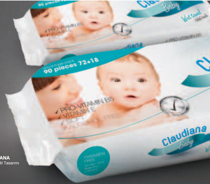
CLAUDIANA Islak Mendil Tasarımı