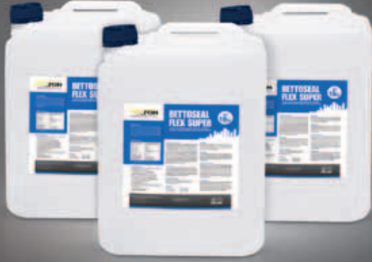
BETTON YAPI KİMYASALLARI Bidon Etiket Tasarımı