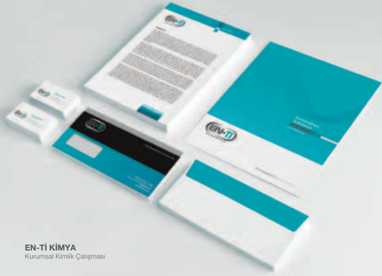
EN-Tİ KİMYA Kurumsal Kimlik Çalışması