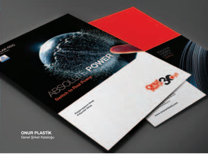
ONUR PLASTİK Genel Şirket Kataloğu